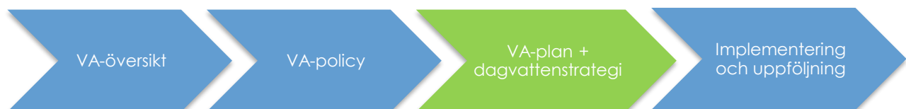
Figur 1. Flödesschema över VA-planeringen. Dagvattenstrategin är en del av det tredje steget i processen.

Tidigare har dagvatten hanterats genom att snabbt leda bort vattnet via ledningar till recipient. Detta ställer höga krav vid förändrade flöden i ledningarna - extrema skyfall kan göra att de bli överbelastade med översvämningar som följd. En alltför snabb bortledning av dagvattnet har även som följd att stora mängder föroreningar släpps ut orenat i sjöar och vattendrag. Idag finns kunskapen om att en mer öppen och fördröjd hantering av dagvatten förhindrar den nämnda problematiken. Dagvattnet kan till och med anses som en resurs i mark- och vattenplanering när växtbäddar, dammar eller kanaler skapas i tätorten för att bidra till trivsamma miljöer.