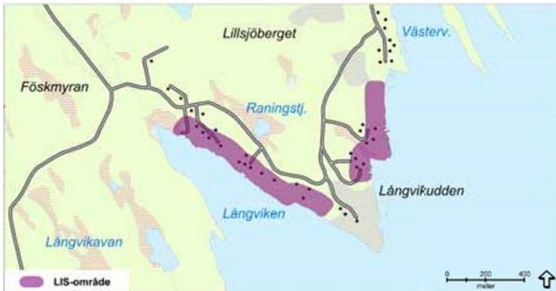
Kartbild ur "Strandskydd i Umeregionen" över Långviken mm.

Ställningstagande: Exploatering vid Lillsjöberget föregås av detaljplan där hänsyn tas till landskapsbilden. Vatten och avlopp bör lösas med gemensamhetsanläggning vid grupper om fler än fem bostadshus. En förtätning av bebyggelse i Långviken bör vara möjlig, för det krävs detaljplan. Avloppen löses enskilt inom varje fastighet.