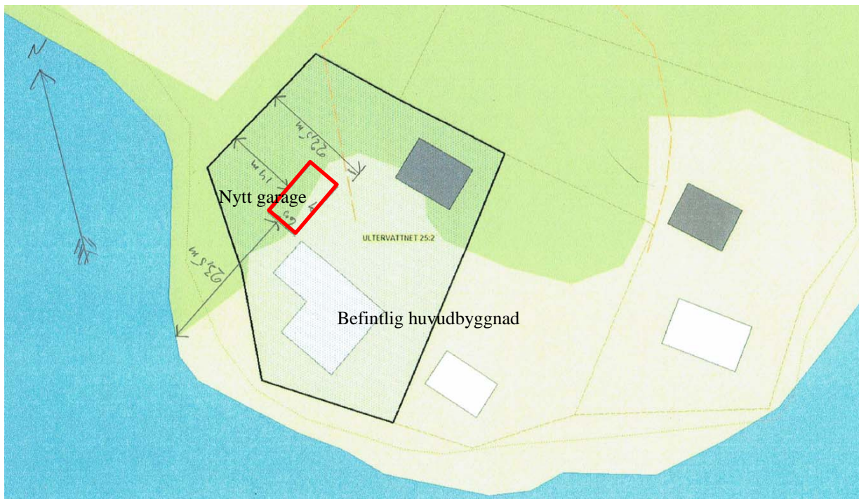
Situationsplan i ansökan (med förtydligande)