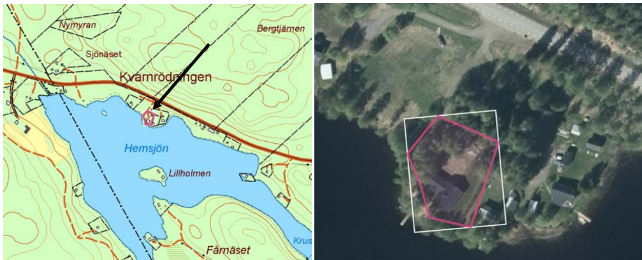
Fastighetskartor där Ultervattnet 25:2 markeras med rosa (metria.se, 2017-04-04)

Ansökan avser strandskyddsdispens för nybyggnad av garage inom fastigheten Ultervattnet 25:2 vid Tryssjön/Hemsjön i Robertsfors kommun.