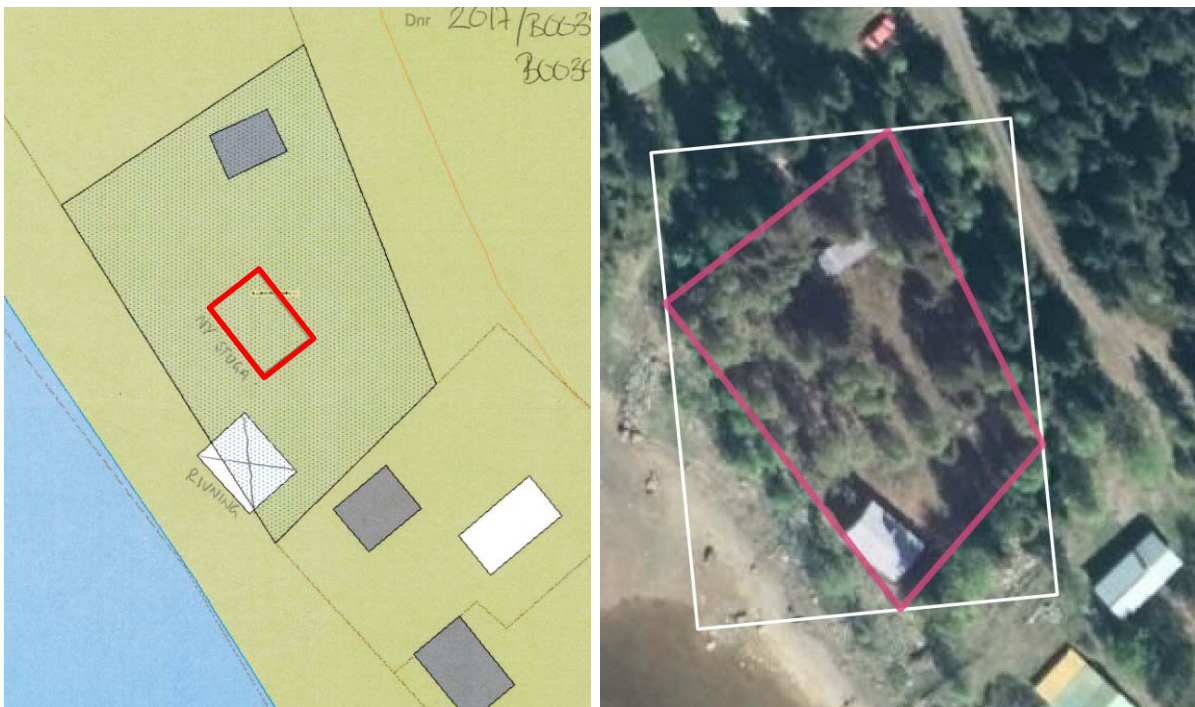
Situationsplan i ansökan (nytt hus markeras med rött)/Fastighetskarta (metria.se 2017-03-15)