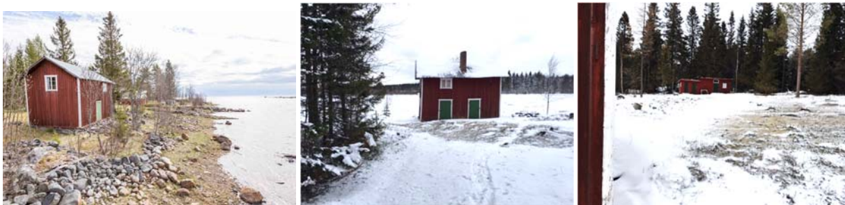
Foton från tomten och strandlinjen