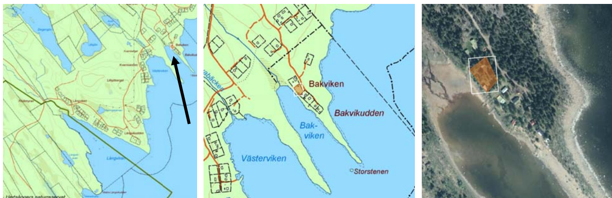
Fastighetskartor där Bjurmyrkammen 4:1 markeras med orange

Det gamla fritidshuset (huvudbyggnad) rivs och ersätts med en ny byggnad (cirka 80m 2 ). Nytt fritidshus placeras cirka 15 meter norr om den nuvarande huvudbyggnaden, det vill säga längre från stranden. På fastigheten finns även ett mindre förråd som är placerat vid fastighetsgränsen i norr.