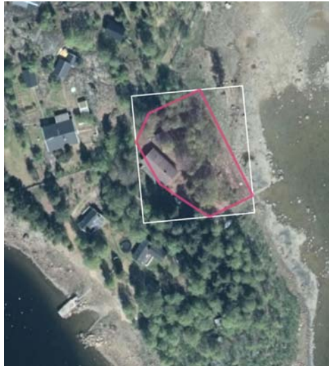
Situationsplan i ansökan (tillbyggnad markeras med rött)/Fastighetskarta (metria.se 2017-03-15)