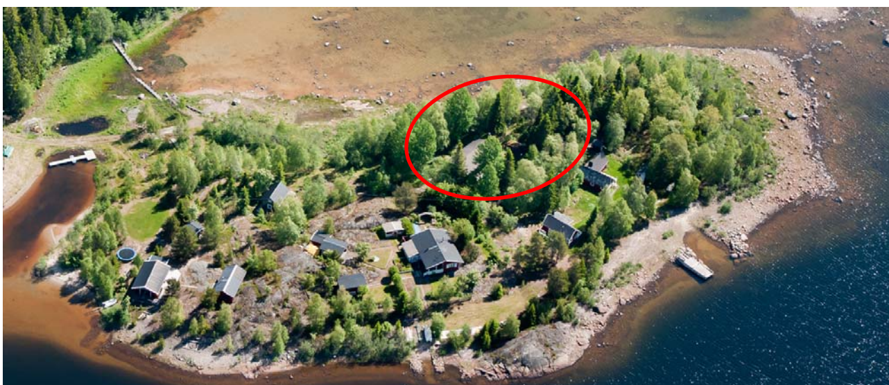
Flygfoto, aktuell fastighet markeras ungefärligen med rött

Fastigheten bedöms, enligt översiktliga kartbilder och flygfoton, vara ianspråktagen sedan tidigare.