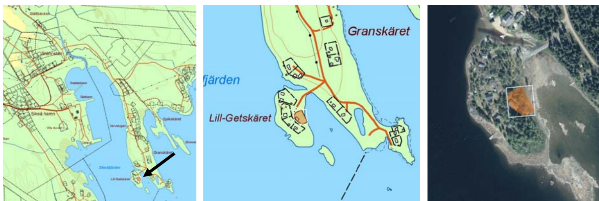
Fastighetskartor där Sikeå Hamn 1:26 markeras med orange

På befintligt fritidshus (huvudbyggnad), i söder, planeras en tillbyggnad i form av ett uterum (cirka 25m 2 ). Mellan stranden och fritidshuset är det cirka 24 meter, utbyggnaden kommer inte att hamna närmare strandlinjen. Fastigheten är även bebyggd med ett förråd som står närmare stranden än huvudbyggnaden, uppskattningsvis 20 meter från stranden.