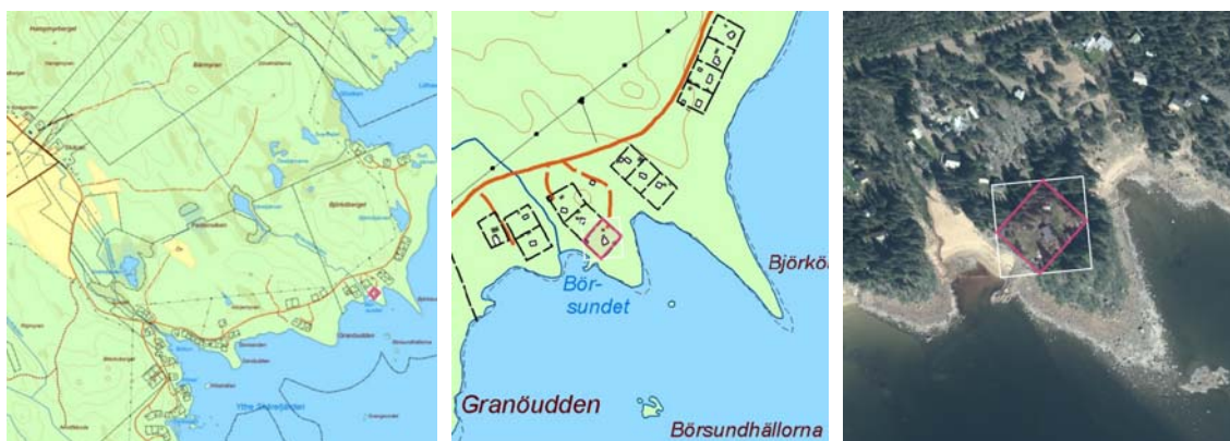
Fastighetskartor där Skäran 15:15 markeras med rosa

Det gamla fritidshuset (huvudbyggnad) rivs och ersätts med en ny byggnad (cirka 130m 2 ). Nytt fritidshus placeras på samma plats där befintlig byggnad står idag. Det nya fritidshuset kommer att bli större än det befintliga men utökningen kommer till största delen att ske mot väg i norr (inte mot stranden).