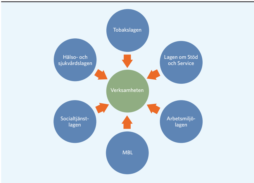
FIGUR 1. Verksamheten påverkas av flera lagar

Tre rättsliga avgöranden som speglar intresseavvägningen mellan arbetsmiljölagen och angränsande lagstiftningar: