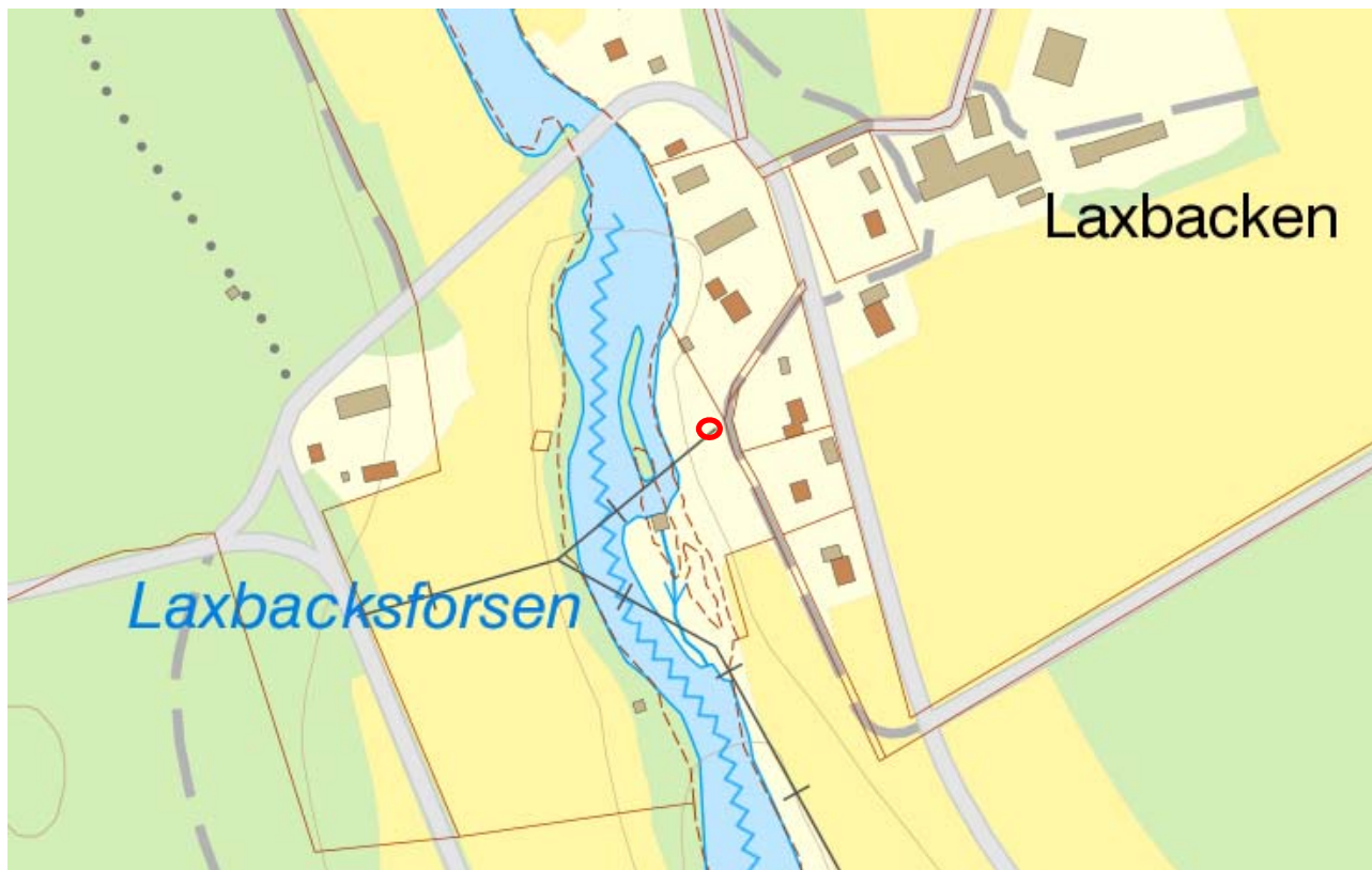
Översiktskarta fastigheten Rickleå 7:18, aktuell plats markeras med rött

Aktuell plats är (enligt översiktliga kartbilder) sedan tidigare bebyggd med luftburen elledning.