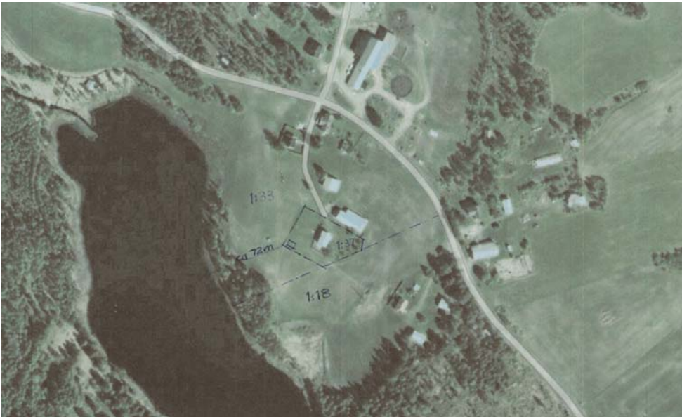
Översiktskarta fastigheten Gulltjärn 1:37 (kartan medföljer ansökan)

Fastigheten är en (enligt översiktliga kartbilder) sedan tidigare ianspråktagen bostadstomt med gräsmatta med mera (jmf med till exempel www.google.se/maps ).