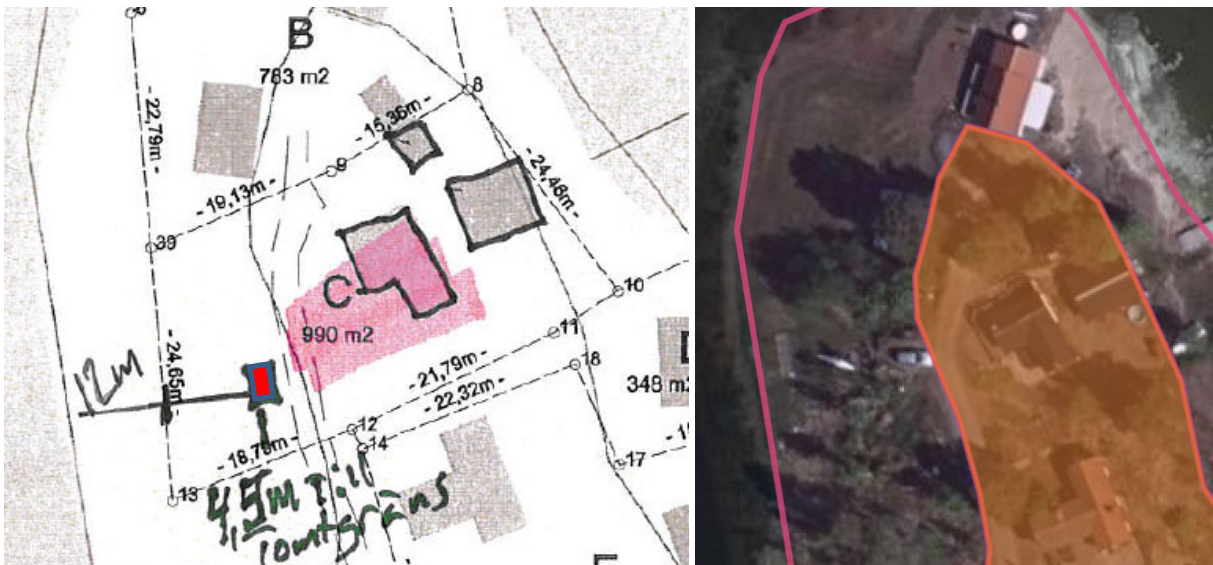
TV: Karta i ansökan (aktuell plats för nybyggnad markeras med rött). TH: Lägde S:2 markeras med rosa (metria.se, 2018-12-20).