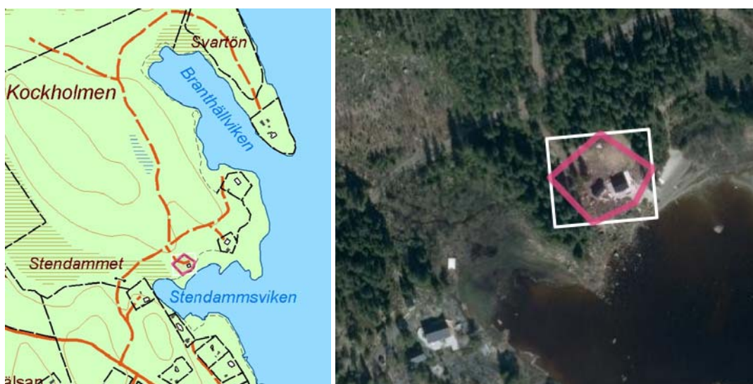
Fastighetskartor där Dalkarlså 11:2 markeras (metria.se, 2018-05-28)

För att hantera avloppet från det nya bostadshuset måste ett enskilt avlopp anläggas i form av infiltrationsanläggning.