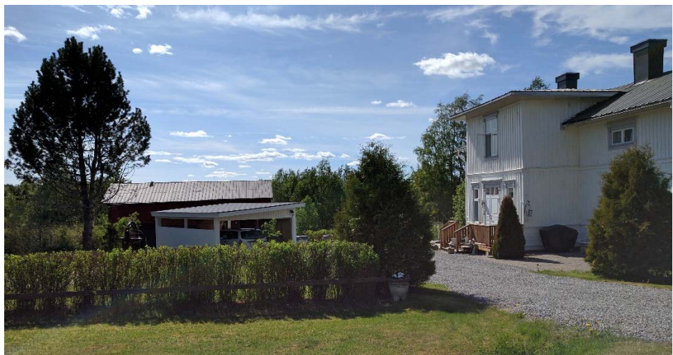
Foton från fastigheten