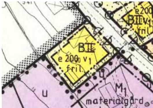
Utklipp från gällande detaljplan

Detaljplanen har ingen genomförandetid kvar.