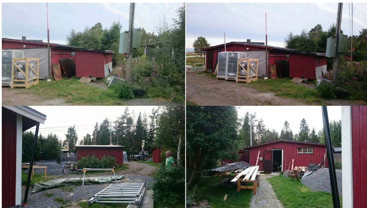
Foton från platsen (bifogade i ansökan). Byggnaderna på bilderna ska rivas och ersättas med garage.